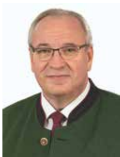
Franz Löffler Landrat und Bezirkstagspräsident

Mit dem „Instrumentenkarussell“ bietet die Landkreismusikschule Cham Kindern die Möglichkeit, auf spielerische Weise verschiedene Instrumente intensiv kennenzulernen. Durch die Rotation in den einzelnen Instrumenten über ein ganzes Schuljahr hinweg sind die Kinder am Ende nicht nur mit sechs verschiedenen Instrumenten vertraut, sondern auch in der Lage, eine Vorliebe für ihr späteres Instrument zu entwickeln.